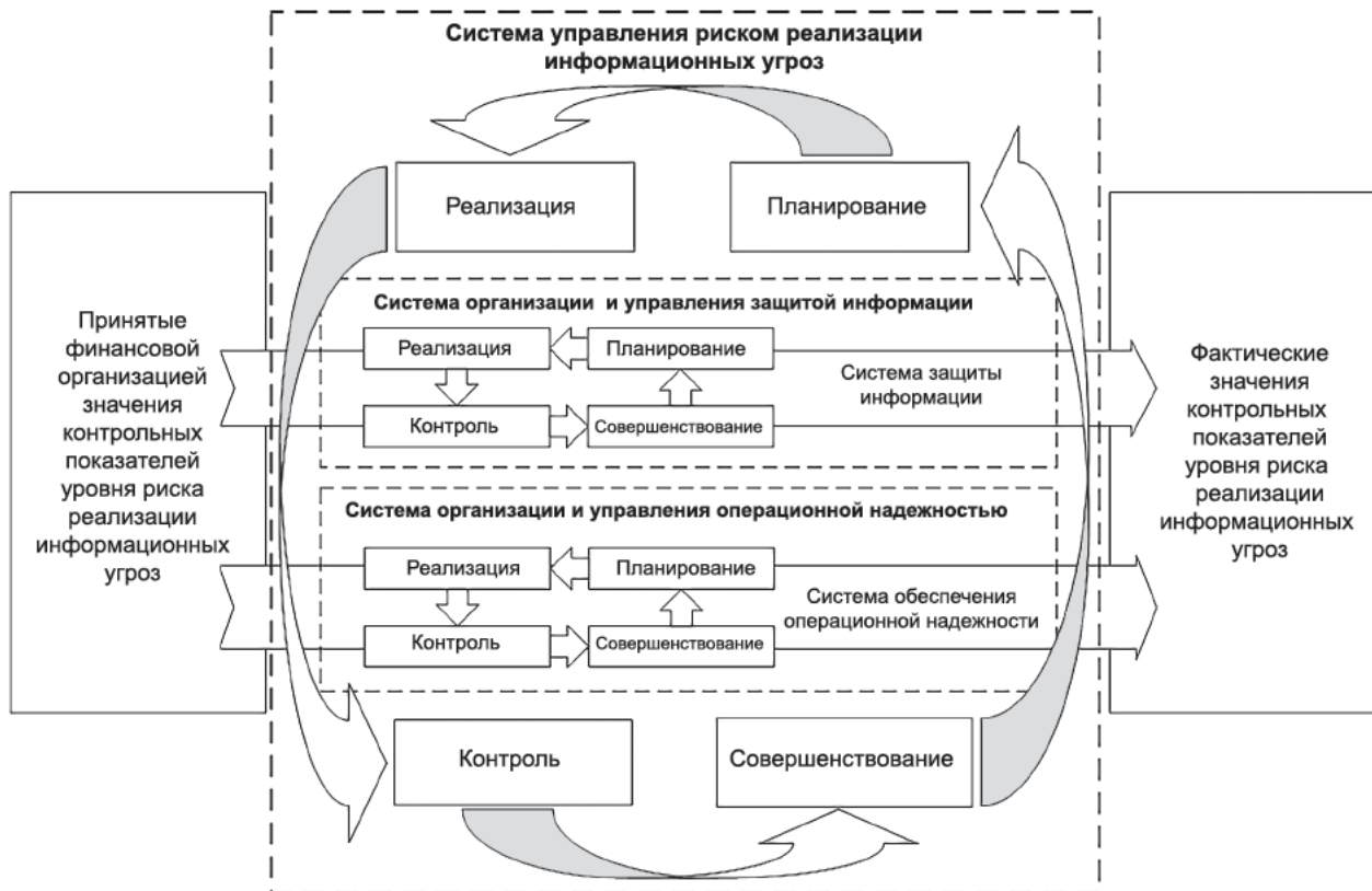
Рисунок 2 — Структура и взаимосвязи системы управления риском реализации информационных угроз финансовой организации и систем управления, определенных в рамках семейств стандартов ОН и ЗИ комплекса стандартов

7.5 Состав направлений, процессов, требований и мер реализуется в рамках системы управления риском реализации информационных угроз систем управления, определенных в рамках семейств стандартов ОН и ЗИ Комплекса стандартов, с учетом структуры и взаимосвязей, приведенных на рисунке 2.